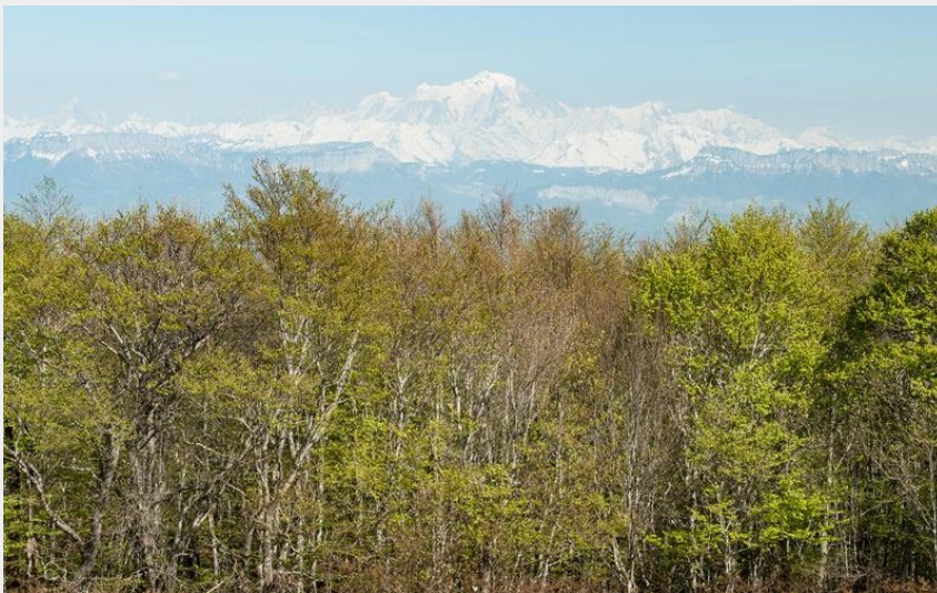
Mont Blanc