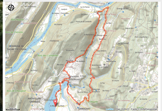
Parcours VTT 72 Rouge - Des Gorges de l'Oignin aux Gorges de l'Ain - Espace FFC Ain Forestière (Jean Yves Crespo)