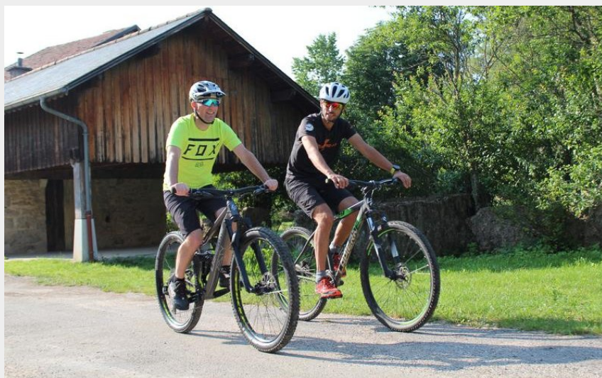
Parcours VTT 53 rouge - Les Cadettes de la Ragiaz - Espace FFC Ain Forestière (Benjamin DESSALES)