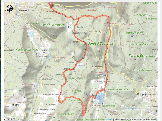
Parcours VTT 70 rouge - D'Oyonnax au lac Genin - Espace FFC Ain Forestière (Denis_Godet_Auberge_lac_genin)