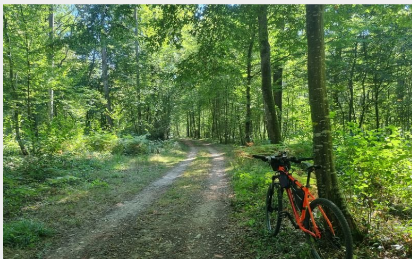
VTT-VTC en Bresse (scalland)