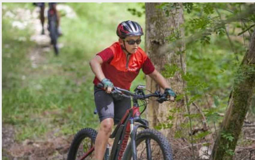
VTT à Giron