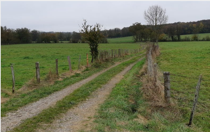
VTT-VTC en Bresse (scalland)