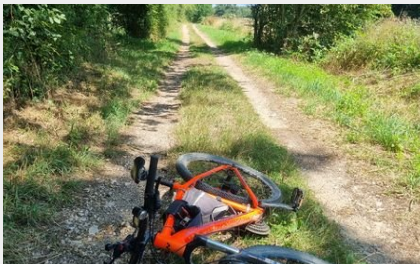
VTT-VTC en Bresse (scalland)