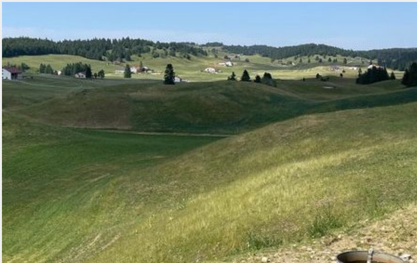
Belle vue sur le plateau du Haut Jura