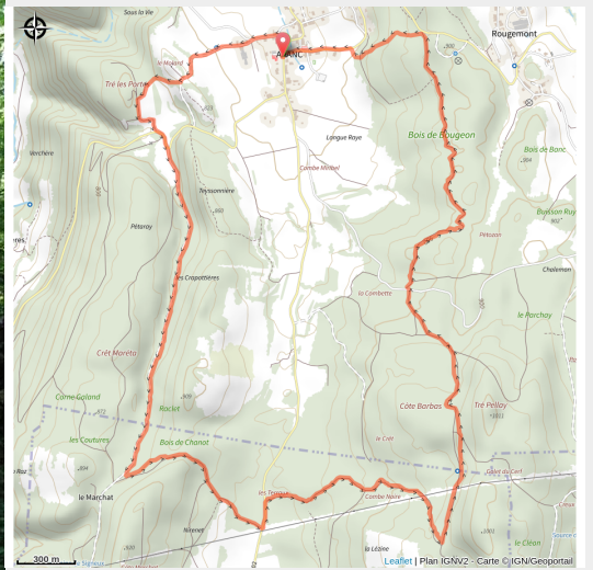
Parcours VTT 54 bleu - Aranc et les Hauts d'Evosges - Espace FFC Ain Forestière (Benjamin Dessales)

Circuit au départ de la mairie d'Aranc. Passage dans le bois de Combe Noire et final sur les superbes singles des Monts d'Aranc .