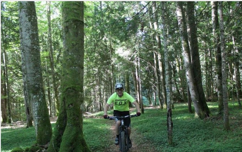
Parcours VTT 57 - bleu - Les étangs marrons - Espace VTT Ain Forestière (Sébastien Beaudon)