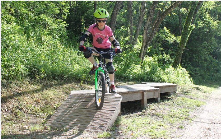
VTT sur la Voie du Tram