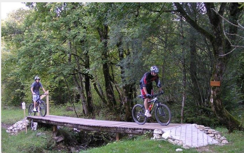
Passerelle en bois (Seb Beaudon)