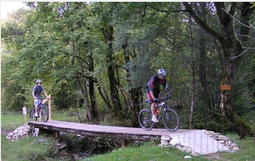
Passerelle en bois (Seb Beaudon)