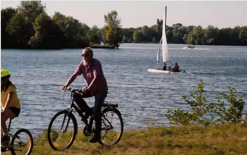
Tour des lacs (La belle rencontre)