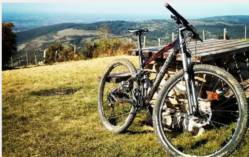
Sommet du Mont Myon - VTT (PetroP)