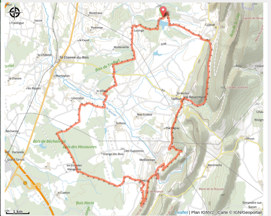
Base VTT Espace Revermont - circuit 4 rouge (Revermont bike)