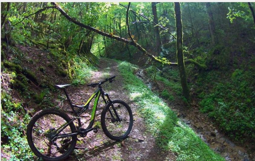
Base VTT Espace Revermont - circuit 4 rouge (Revermont bike)