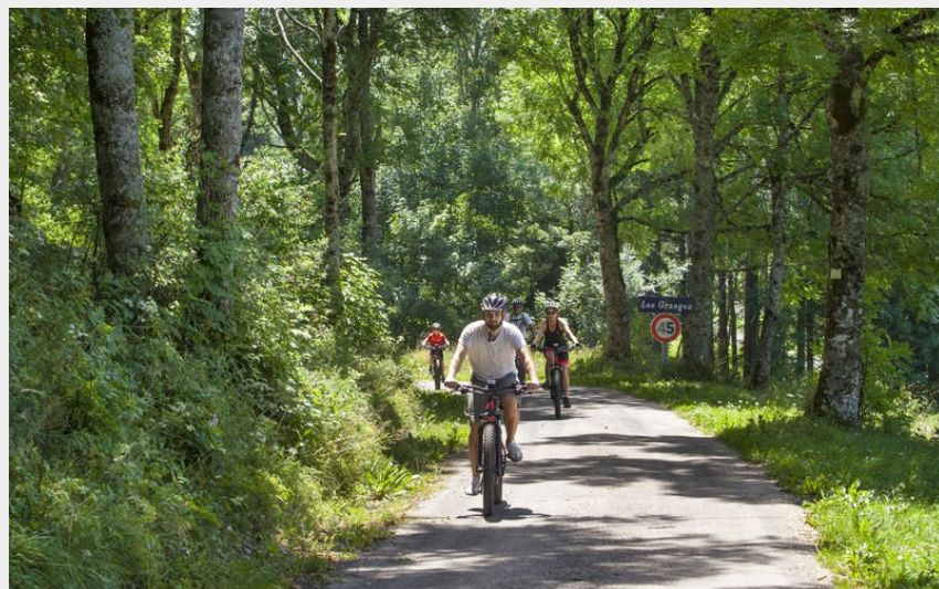
VTT aux alentours de Giron