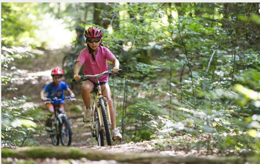
Parcours VTT 61 vert - La Familiale - Espace FFC Ain Forestière