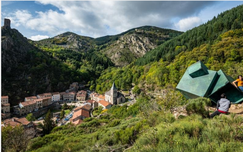
Vue du village depuis l'oeuvre du partage des eaux