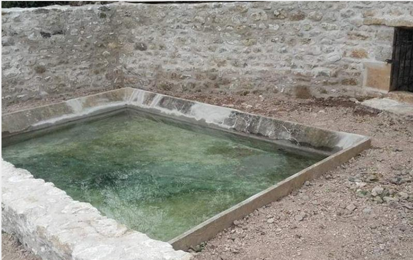
Lavoirs à Sussat (@SUSSATNOTREVILLAGE)