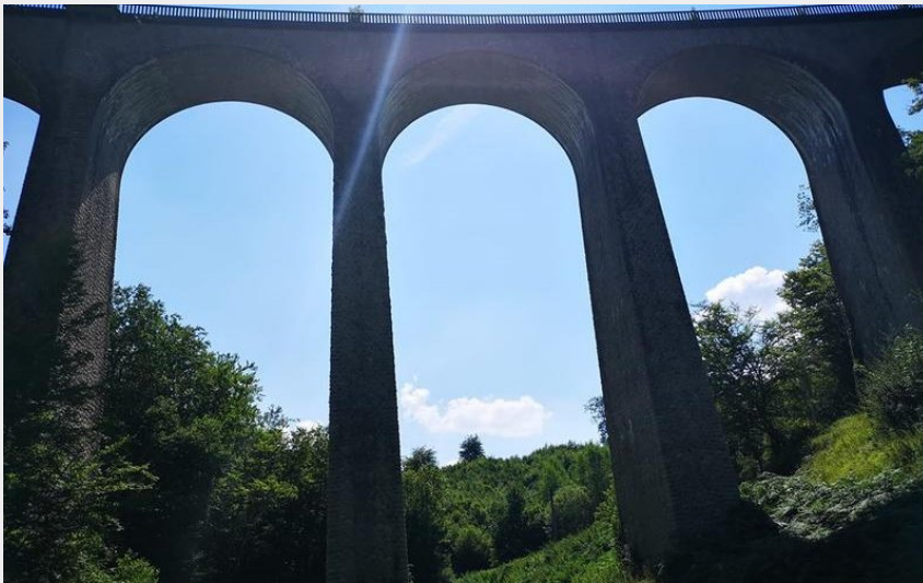
Viaduc de La Perrière (@OTVALDESIOULE)