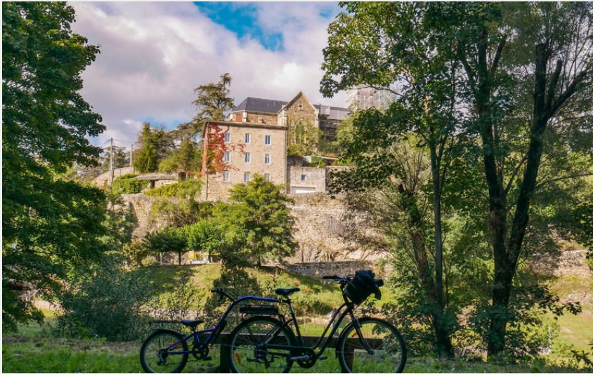
(Les Petits Drômois)