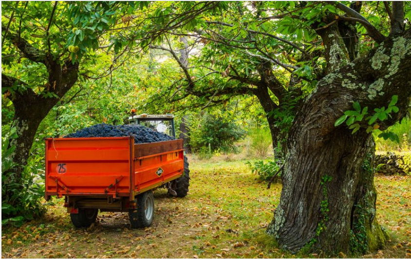
Vignes et châtaigniers se côtoient