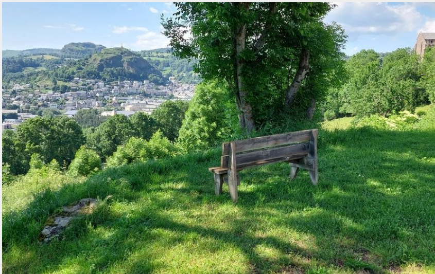
Murat (Cantal Destination)