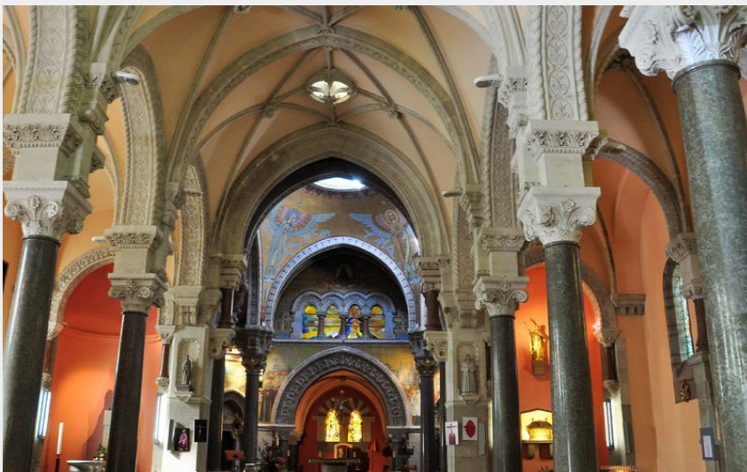
la basilique de Lalouvesc