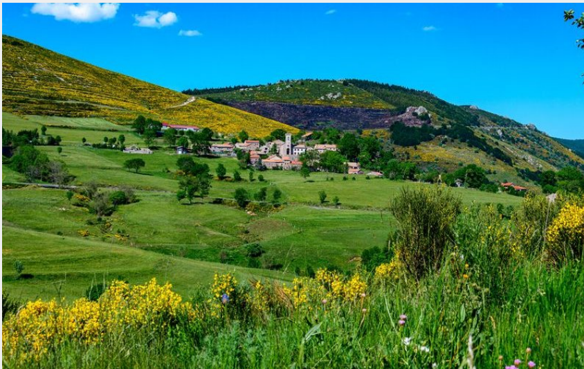
vue du village