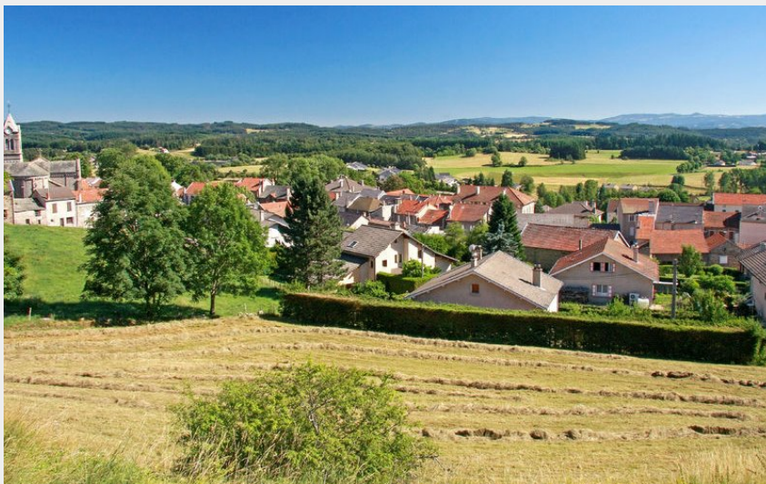
vue de Saint-Agrève