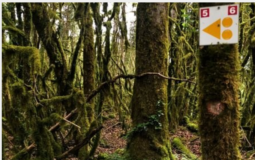
Chemin menant au lac de Chailloux