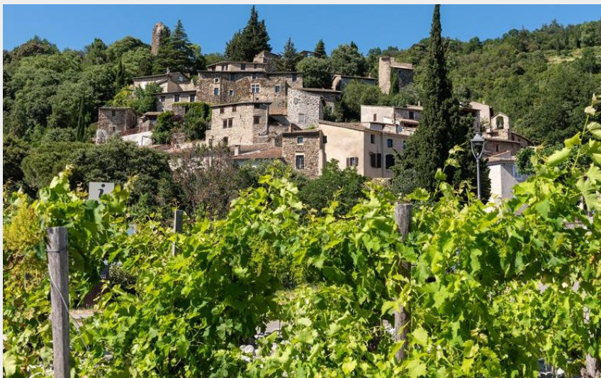
Vue sur le village