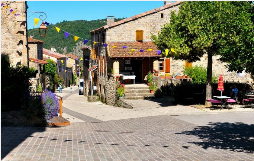
Village de caractère de Boucieu-le-roi