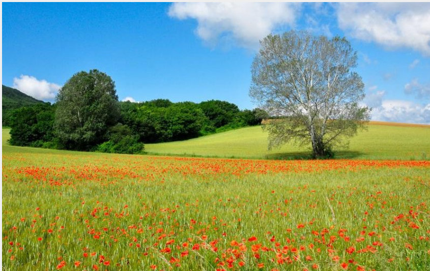
Champ de coquelicots à Saint-Lager-Bressac