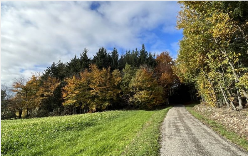
sur la boucle VTCAE