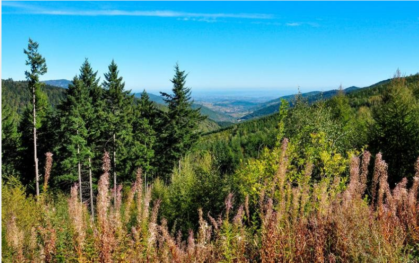
Cold du Marchand