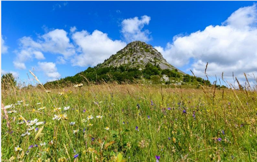
Gerbier de Jonc