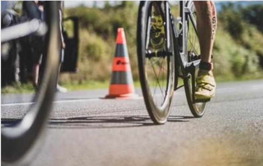
Sur les routes de la Montagne Bourbonnaise (VD)