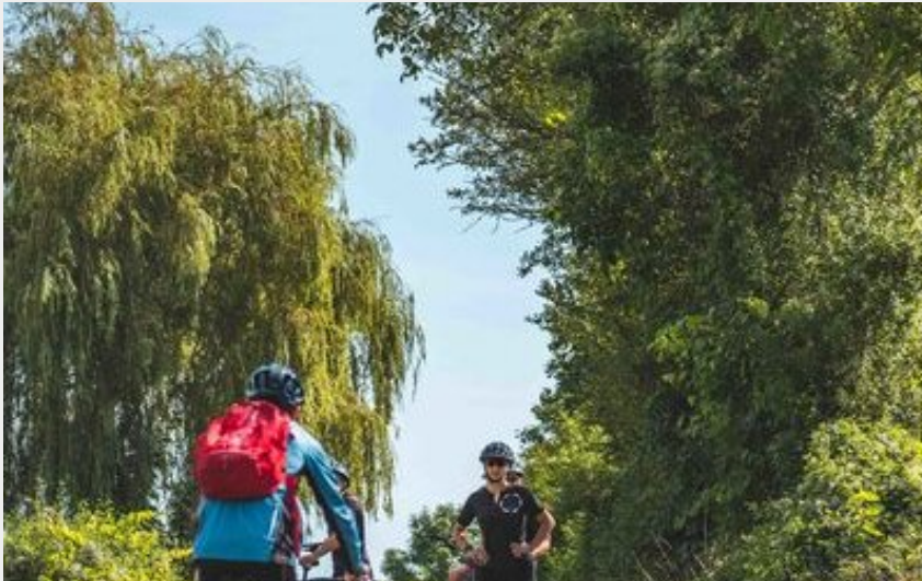
VTT au Vernet