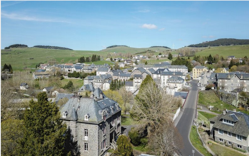
Allanche (Hautes Terres Tourisme)