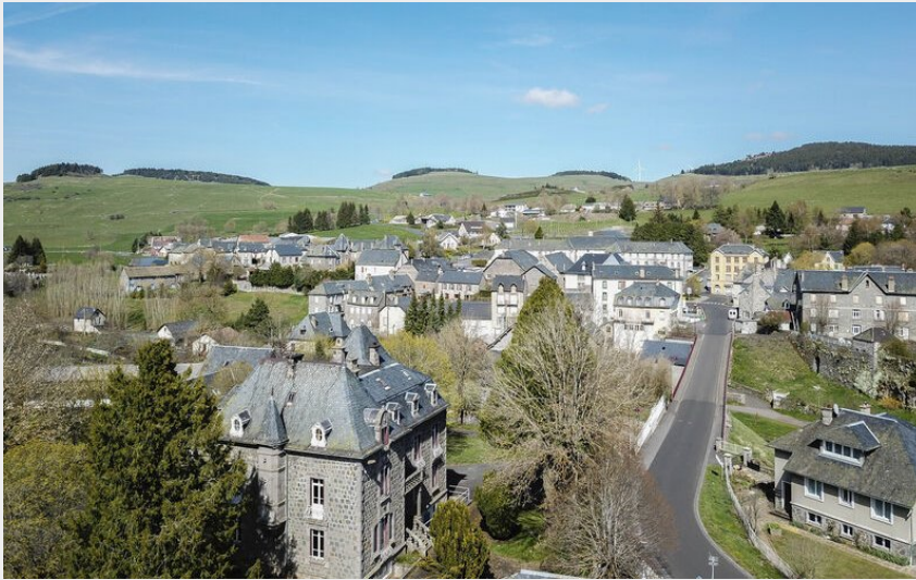
Allanche (Hautes Terres Tourisme)