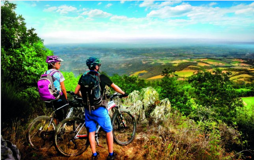
Panorama depuis le Signal ret (Alexandre Moncorgé)