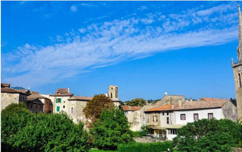
Les Vans