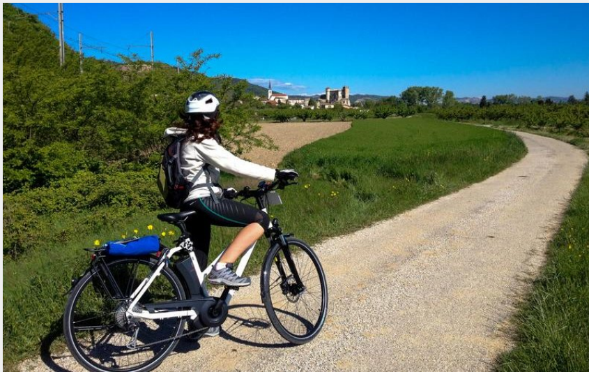
La voie bleue