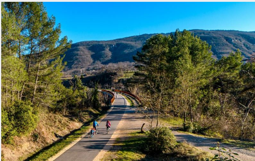
Voie douce de la Payre