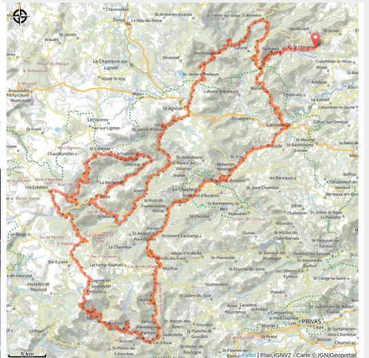
Sur les routes de l'Ardèche

Là, c'est la grande forme qu'il faut avoir et l'entraînement du sportif pour prendre le départ de cette Ardéchoise qui au vu des superlatifs qui la définissent porte à merveille son nom.