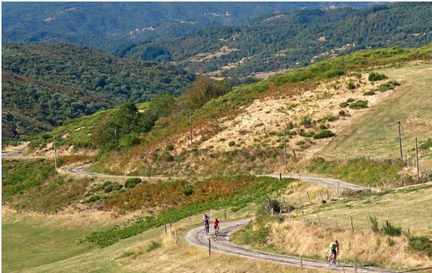
Sur les routes de l'Ardèche