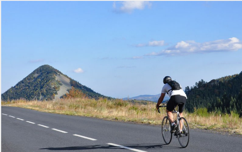
Sur les routes de l'Ardéchoise