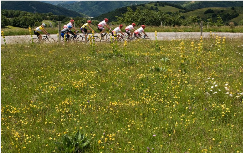
Sur les routes de l'Ardéchoise