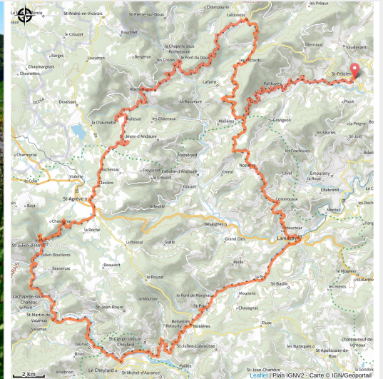
Sur les routes de l'Ardèche

La haute vallée de l'Eyrieux se mérite entre paysages grimpants jusqu'à en devenir montagnards et villages au riche passé industriel. Depuis St-Félicien et le Col des Nonières, cet itinéraire rejoint St-Agrève, balcon des Cévennes à 1088 m d'altitude.