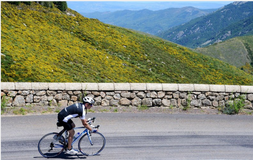
Sur les routes de l'Ardèche