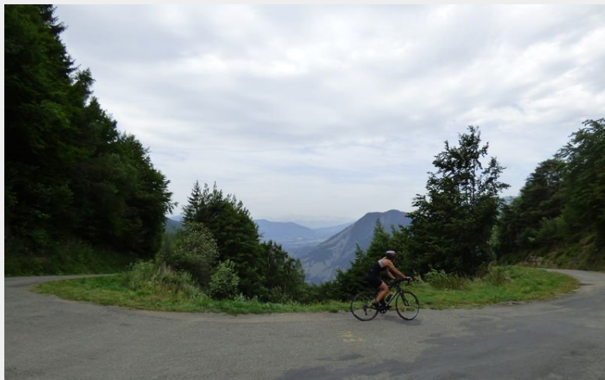
Vélo de route - Col de Parquetout - Matheysine - Alpes Isère (Louise De Guyon)