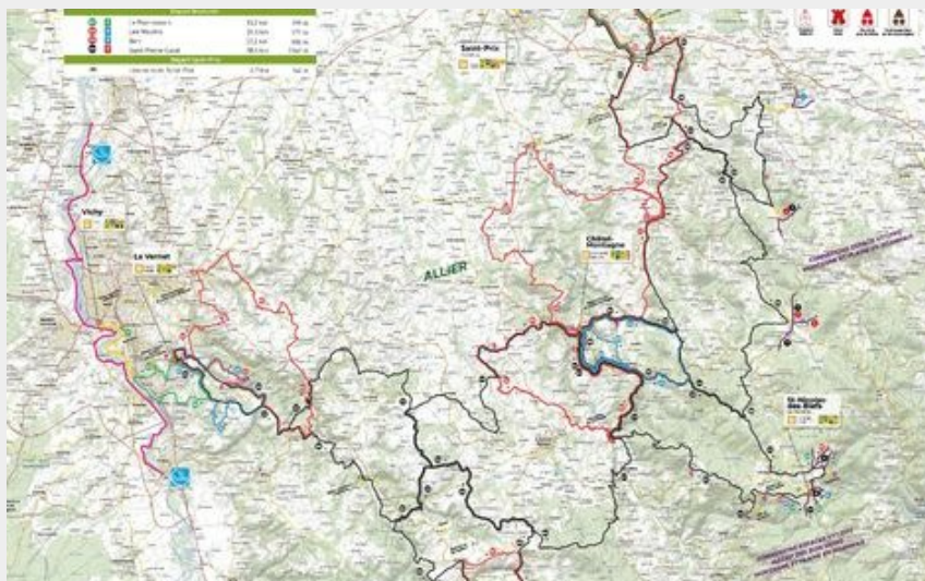
Carte espace VTT (Vichy Co)